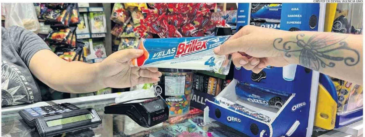
EL CORTE DE LUZ AFECTÓ A 14 REGIONES DEL PAÍS. EN LA REGIÓN FUERON MÁS DE 160 MIL CLIENTES QUE SE VIERON PERJUDICADOS POR EL CORTE DE SUMINISTRO.

“La gente la verdad hizo caso y lograron de manera tranquila retirarse a sus domicilios. Tuvimos más de 4.180 salvoconductos”, dijo el general. Además, acotó que “tuvimos a través de los más de 600 controles de aire vehiculares, cuatro detenidos. De esos, uno por desacato, otro por ley de pesca y dos por órdenes vigentes. Solamente hubo uno que cometió la infracción por el toque de queda”.