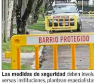
Las medidas de seguridad deben involucrar un esfuerzo mancomunado entre diversas instituciones, plantean especialistas.

Añade que "luego la estrategia debe considerar incentivos económicos para las familias y municipios para la reinserción escolar de jóvenes desahuciados..."