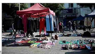
DERRUIDOS.— Sectores de la capital como Meiggs o la Vega Central se han deteriorado de la mano de la actividad informal.

Con distintos tipos de medidas, que van desde equipos de fiscalización hasta el aumento de permisos municipales, algunas autoridades han buscado enfrentar el fenómeno del comercio ambulante, que prolifera en barrios comerciales de las distintas ciudades.