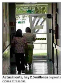
Actualmente, hay 2,5 millones de prestaciones atrasadas.

Corregir, por un lado, los modelos de gestión y de atención del sistema público de salud, para aumentar la productividad del sistema y reducir las brechas entre la oferta y la demanda de servicios de salud."