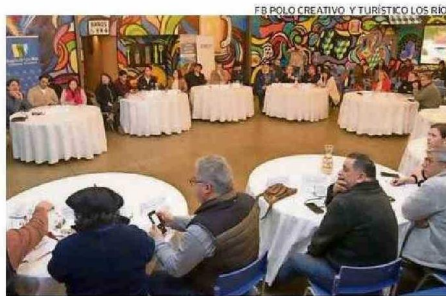
EL CONSEJO REGIONAL DE TURISMO SE REACTIVÓ EN MEDIO DEL PROYECTO.

oportunidades de negocios conjuntos como por ejemplo turismo creativo, turismo cultural, destinos creativos para poner en valor, que el polo creativo puede impulsar y desarrollar”.