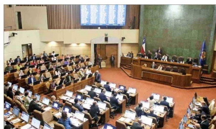
Durante toda esta semana se extenderá la votación del Presupuesto 2025 en la Sala de la Cámara de Diputados.

El ministro también hizo mención a la reducción del número de conscriptos en los últimos años, lo que ha afectado el flujo de estos hacia el escalafón de soldados profesionales. "Entre 2018 y 2022 la dotación de soldados conscriptos se redujo de 11 mil a 5 mil. Posteriormente, hubo un incremento en los últimos dos años, se ha aumentado en cerca de mil los soldados conscriptos. Al haber una reducción en el número de conscriptos, naturalmente hay un menor contingente de potenciales entrantes a la tropa profesional y eso hizo que prácticamente en todos los años, desde 2018 hasta ahora, siempre la do-