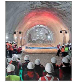
Proyecto estaría terminado en 2028 y uniría Renca con Vitacura.

A 40 metros bajo tierra, en medio del Parque Araucano, se produce segundo encuentro de túneles de la Línea 7 del metro | C 1