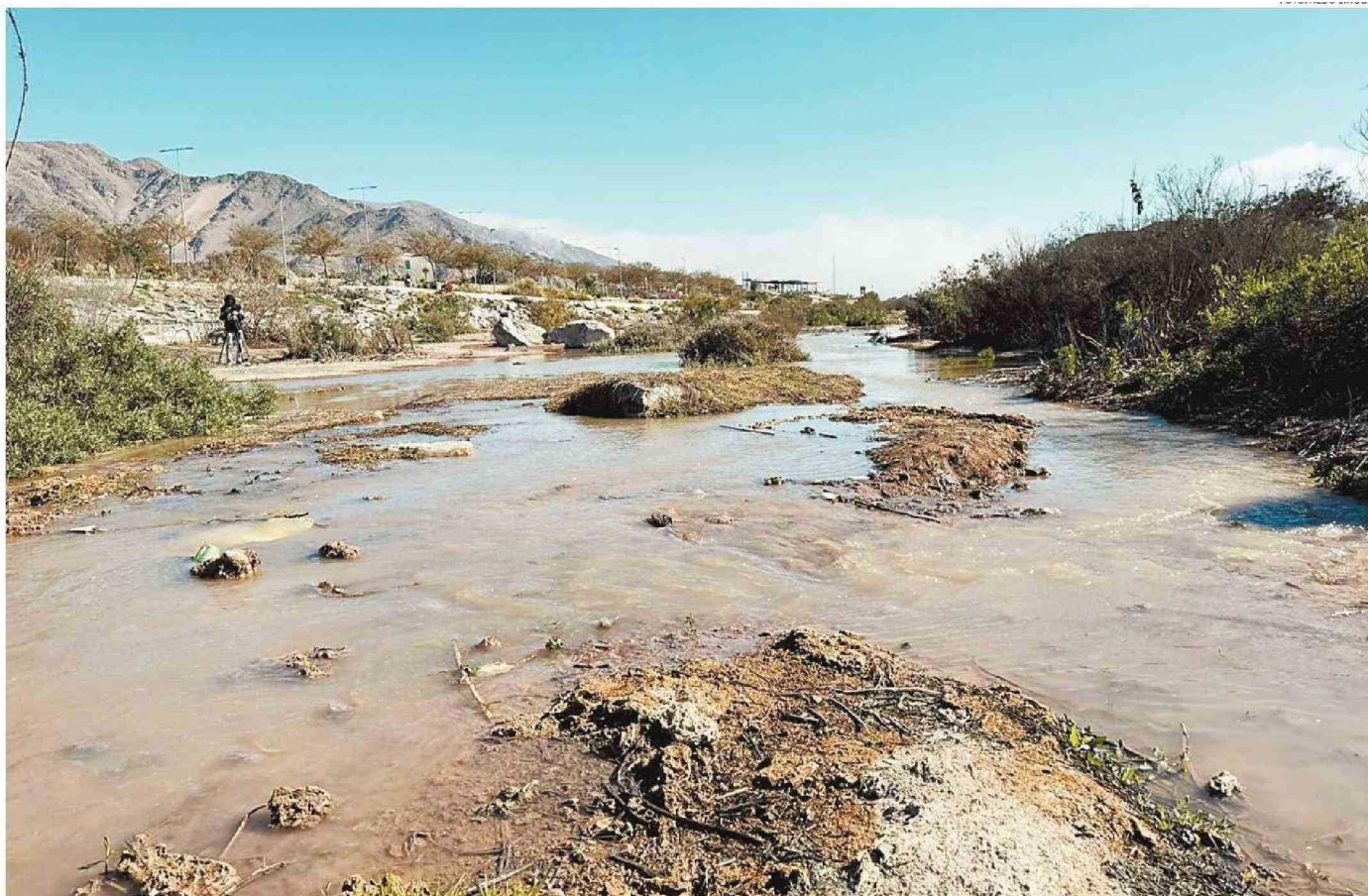
SE ESPERA QUE EL CAUCE DEL RÍO RECUPERE LA FLORA Y FAUNA NATIVA, Y QUE PUEDA CONVERTIRSE EN UN ESPACIO DE ENCUENTRO PARA LOS COPIAPINOS.