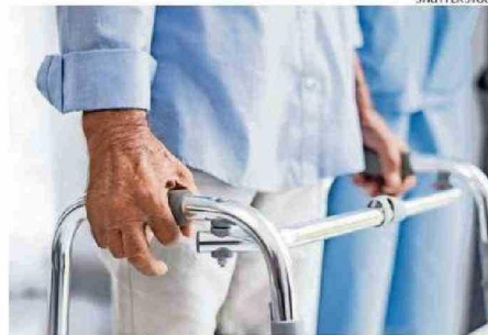
ESTUDIO LO REALIZÓ PRESTIGIOSO INSTITUTO ISRAELÍ.

En ratas con insuficiencia cardíaca, el acetato de glatiramero mejoró la capacidad de bombeo del corazón y ralentizó la acumulación de tejido cicatricial en el corazón caracte-