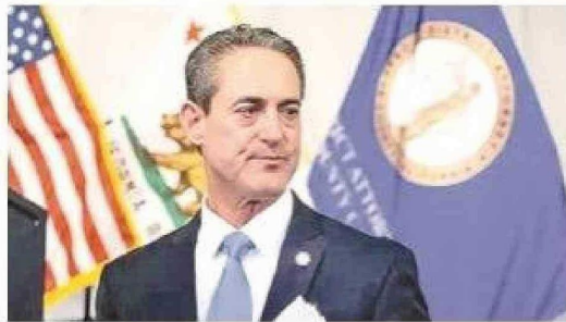
Todd Spitzer, fiscal del distrito de Orange, en California, publicó un extenso mensaje en redes sociales donde pide a los legisladores tomar "medidas inmediatas".

Así, a través de su cuenta en X, el fiscal Spitzer aseguró que "Chile, que se unió al VWP en 2013, ha fallado sistemáticamente