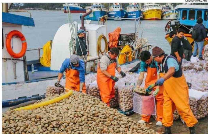
ESTE AÑO EL FOCO DEL PLAN ESTARÁ EN LA PESCA ARTESANAL CON UN AUMENTO DE RECURSOS.

“Ya el año 2024 el Gobierno Regional aprobó recursos para el bicentenario, esos recursos se aumentan en un