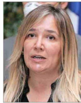
María José Hoffmann (37,49%) postuló por Valparaíso.