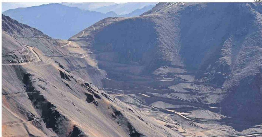
A LA PAR DEL CIERRE DEL PROYECTO PASCUA, BARRICK ESPERA INICIAR EXPLORACIONES PARA EL DESARROLLO DE OTRO PROYECTO MINERO.

Así, Barrick busca realizar 62 sondeos en dos temporadas de verano, los que se reali-