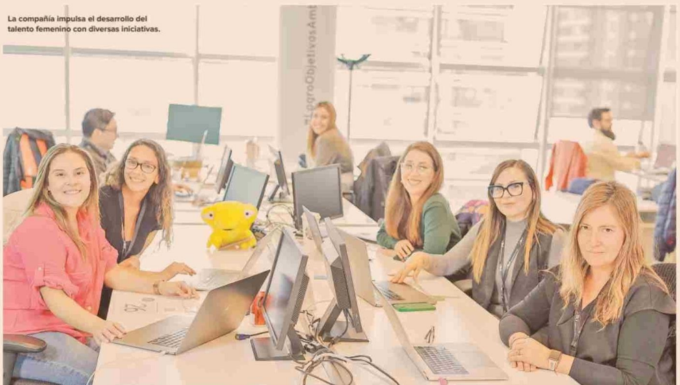
La compañía impulsa el desarrollo del talento femenino con diversas iniciativas.

hacia posiciones de toma de decisiones. Este enfoque ha llevado a Bci a obtener varios reconocimientos, como el premio "Valorando la maternidad" en los Latam Inclusive Tech Awards y el primer lugar en el ranking EFY FEM 2024 como la mejor empresa para el talento femenino en Chile y también alcanzó el cuarto puesto en el Monitor Empresarial de Reputación Corporativa (Merco Talento).