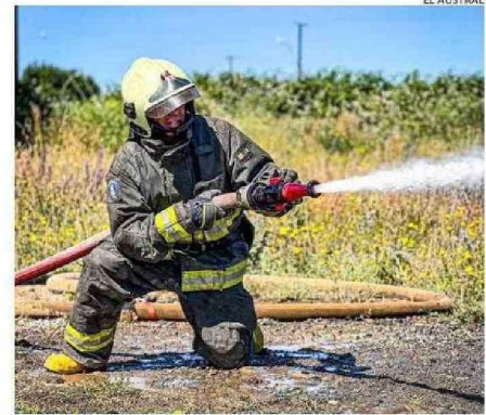
BOMBEROS EXTINGUIÓ EL FUEGO ILEGAL EN LA PARCELA DE PELLECO.