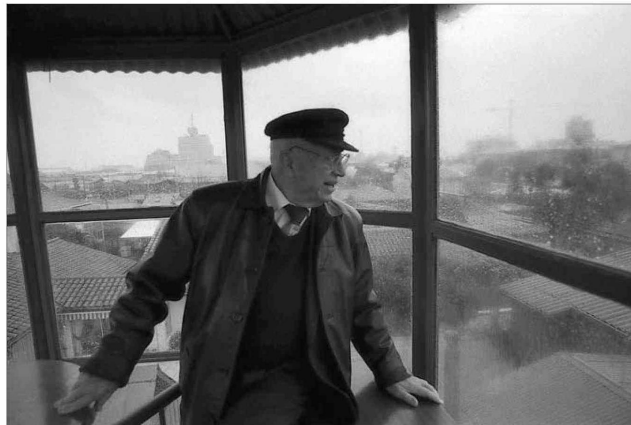
Este retrato de Gonzalo Rojas forma parte de la muestra. Es un proyecto en el que participan, entre otros, la Vicerrectoría de Comunicaciones, el Instituto VioDemos y la Escuela de Psicología UC.

Montados en paneles de madera en la explanada del Centro de Extensión, se presentarán retratos de, entre otros, Armando Uribe, Pablo Neruda, Nicanor Parra, Isabel Allende, Raúl Zurita, Lina Meruane y María José Ferrada. La muestra se pensó para conmemorar los 60 años de trayectoria de Poirot y celebrar agosto, el Mes de la Fotografía.