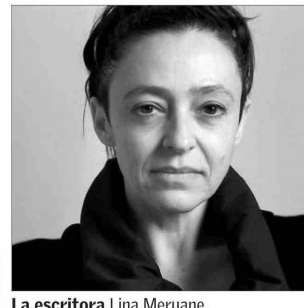
La escritora Lina Meruane.

—¿Qué es lo que sostiene esta persistente motivación suya de retratar a escritores?