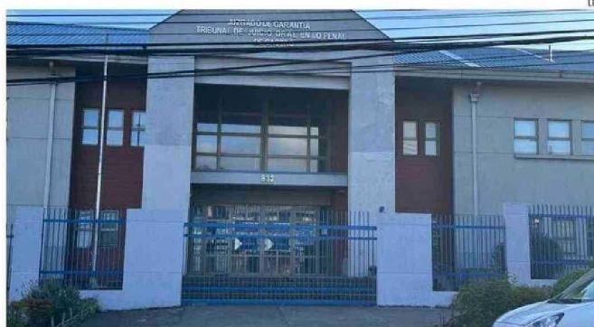
TRIBUNAL DE GARANTÍA DE CASTRO ACEPTÓ AMPLIAR LA DETENCIÓN POR TRES DÍAS.

Tras ello, la Fiscalía instruyó a peritos de la PDI realizar las diligencias que permitieran identificar a la víctima y dar con el paradero del responsable, identifica-