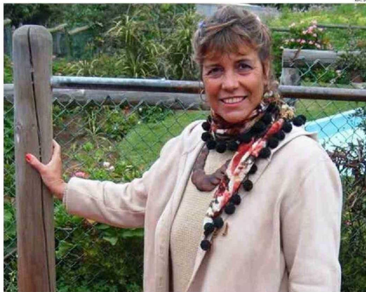
LA MUJER ERA ORIUNDA DE SANTIAGO Y HACE UNA DÉCADA RESIDÍA EN CHILOÉ.