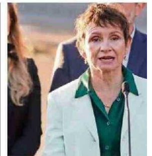
LA JEFA DE GABINETE HABLÓ SOBRE LA

Tohá: la suspen- de vuelos ve es “inhuma