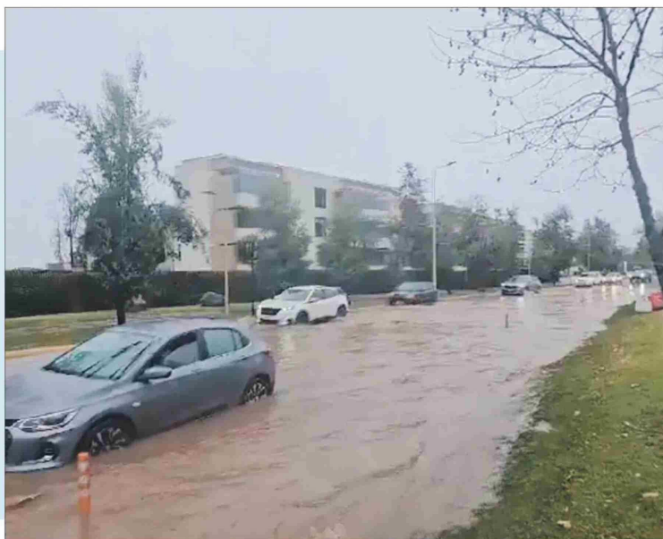
CAPTURA DE PANTALLA

Cerca de las 10.30 de este viernes, horas la Municipalidad de Las Condes recomendaba evitar circular por Avenida La Plaza a la altura del 1451, debido a que se encontraba parcialmente inundada. Una vez cortado el tránsito de la avenida mencionada, se habilitó una sola vía de circulación habilitada. Un equipo con un camión Jet llegó al lugar para realizar trabajos de remediación. Otras calles anegadas fueron Francisco Bulnes Correa, a la altura del 2328; Alonso de Córdova, en 4212; Vespucio Sur 507, entre otras. Desde el municipio anunciaron que sus equipos fueron desplegados a los distintos puntos de la comuna afectados.