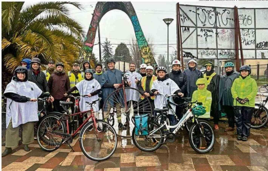
EL SECRETARIO DE ESTADO RECORRIÓ PARTE DE LAS OBRAS DEL PROYECTO DE CICLOVÍAS EN LA CIUDAD DE VALDIVIA.

el Ministerio de Transportes publicó licitación de estudio que busca generar un diagnóstico del sistema de transportes intrarregional. El modo tren será evaluado.