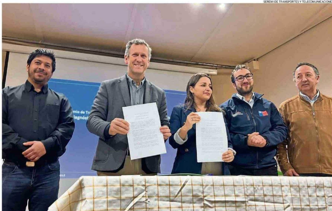
EN VALDIVIA SE CONCRETÓ AYER LA FIRMA DE UN CONVENIO ENTRE EL MINISTERIO DE TRANSPORTES Y LA MUNICIPALIDAD DE LA CAPITAL DE LOS RÍOS.