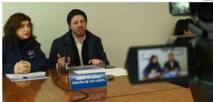
AUTORIDADES ENTREGANDO EL BALANCE REGIONAL DE LA CAMPAÑA DE INVIERNO.