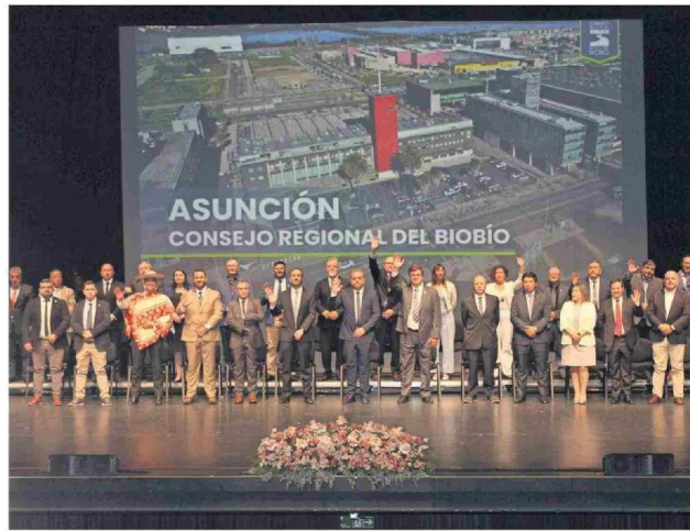
ACTUALIDAD 3 El Consejo Regional y el nuevo gobernador Sergio Giacaman (al centro) al término de la ceremonia realizada en el Teatro Biobío.

▶ También anunció que una parte importante de su gestión será apoyar a las policías y que "el terrorismo en cualquier parte es inaceptable". Por su lado, Díaz sostuvo que, pese a los problemas, "la institucionalidad regional está más robusta".