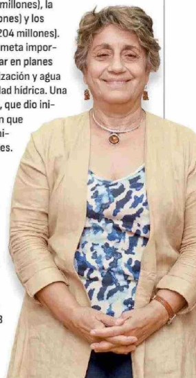
Jessica López, ministra de Obras Públicas.

3. Asociación público-privada. Este año la Dirección General de Concesiones "seguirá acelerando licitaciones de nuestra cartera de proyectos". En línea con el resurgimiento del sistema de concesiones en los últimos dos años, el MOP seguirá impulsando durante el presente ejercicio su cartera de proyectos 2024-2028, que incluye 43 contratos. De ellos, 26 corresponden a iniciativas en las áreas de transporte y edificación públicas, 13 a carreteras, dos a aeropuertos e igual número a infraestructura hídrica.