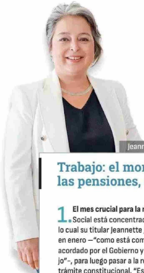
Jeannette Jara, ministra del Trabajo y Previsión Social.