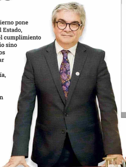
Mario Marcel, ministro de Hacienda

El inicio del último año de Gobierno pone presión a toda la estructura del Estado, obligando no sólo a extremar el cumplimiento de los planes de cada ministerio sino también a priorizar los objetivos principales que busca concretar la actual administración. Las carteras de Hacienda, Economía, Minería, Obras Públicas, Trabajo y Transportes y Telecomunicaciones definieron sus metas para la recta final.