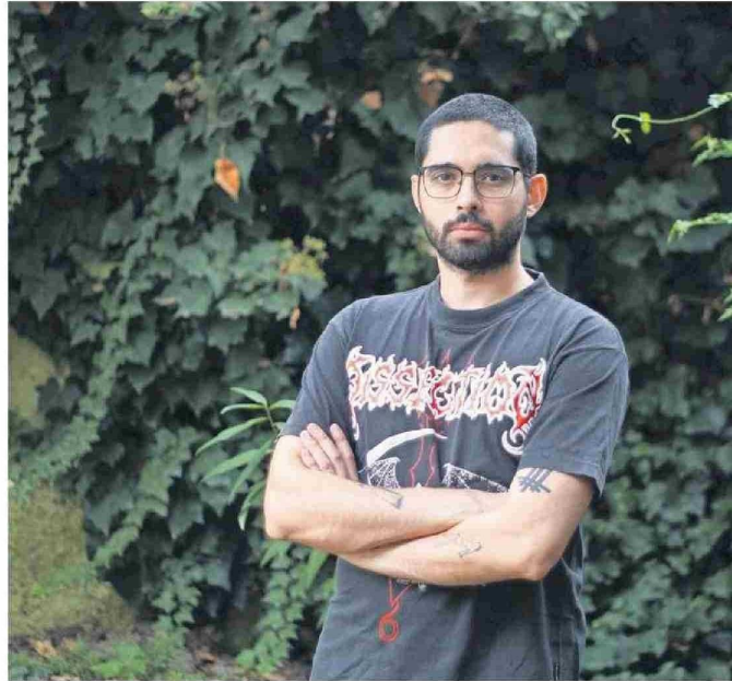
"Me pareció más bien un deber publicar algo para que se hable del tema" de la salud mental, dice el autor.

"La alucinación es más compleja porque te altera la realidad, por ejemplo, en vez de ver un auto ves a un perro y te pueden atropellar por eso, entonces es más complejo porque estaba comprometido mi vínculo con la realidad", agrega el también exbecario de Fundación Neruda, que en "Psicosis lúcida" recuerda a su cuidador, quien falleció al poco tiempo de recibir el alta médica. Al enterarse, escribió Miranda, "esa noche fue una de las más dolorosas. También sentí, no exento de un narcisismo ridículo, que la misión de Pedro había