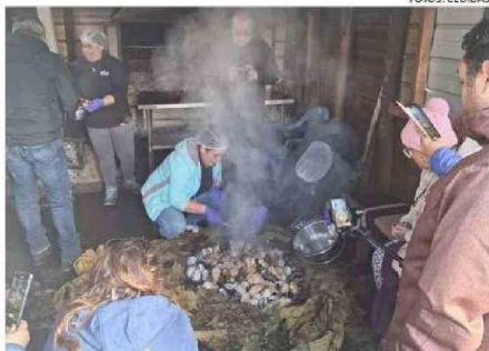
EN EL TURISMO RURAL, EL CURANTO AL HOYO ES UNA ESTRELLA.