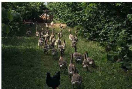
EN EL RINCÓN DE ARTURITO LAS AVES SON PARTE DE LA GRANJA.