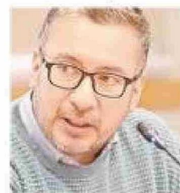
Rodolfo Moncada Salazar regresará al ámbito privado.

Tras cerrar este capítulo de su carrera pública, Moncada regresará al ámbito