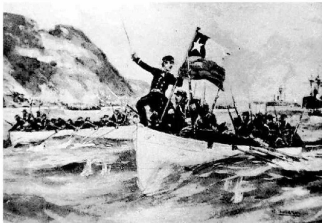
REPRESENTACIÓN DEL ASALTO Y TOMA DE PISAGUA, QUE TUVO A SANTA CRUZ COMO PROTAGONISTA.

El historiador aporta que "cuando se levantó la niebla, Santa Cruz comprobó que había perdido la dirección hacia su objetivo y, en cambio, desfilaba por la ceja, a la vista enemiga de la aldea de Tarapacá. El adversario lo había visto, por lo que sus cornetas tocaron la alerta. Los oficiales de artillería de su columna solicitaron autorización para