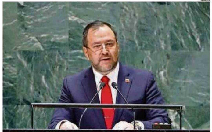
El canciller venezolano, Yvan Gil, dijo que Boric estaba "a la derecha de Milei".

Por su parte la ONG Provea dijo ayer que al menos 24 personas han fallecido en medio de las protestas en Venezuela. Esa cifra no ha sido confirmada por el régimen chavista.