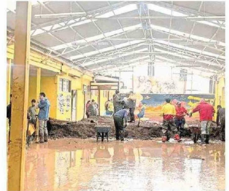
LICEO POLITÉCNICO DE CURANILAHUE TAMBIÉN QUEDÓ BAJO EL AGUA.

Colegio de Profesores mostró su preocupación por las condiciones en que se producirá el regreso de vacaciones de invierno. Mineduc comprometió apoyo.