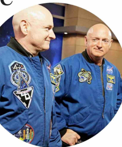
Mark Kelly y su gemelo Scott participaron en experimentos para medir los cambios fisiológicos. Scott participó en una misión de 340 días, mientras su hermano era el grupo de control acá en la Tierra.

Otro de los estudios fue Time Perception que ayudó a comprender cómo los astronautas perciben el espacio y el tiempo y los efectos del espacio en la coordinación motora. En la foto, Megan McArthur, usando unos cascos de realidad virtual.