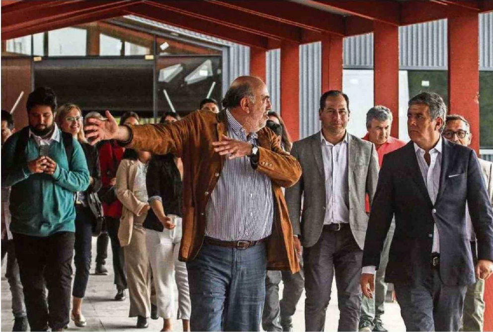
AUTORIDADES REGIONALES CONOCIERON EL TERMINAL DE PASAJEROS EN PUERTO MONTT. SE PROYECTA CONSTRUIR OTRO EN LA BAHÍA DE ANCUD. (viene de la página anterior)

efecto negativo en Puerto Varas. Estableció que para que se desarrolle la región desde la perspectiva del turismo, se debe apoyar todos los destinos. "Si pensamos en un destino en particular, con una inversión que le duele al otro destino en particular por otra inversión, es que no estamos viendo el sistema económico, el beneficio cultural, el rédito que le dé a quienes invierten, a los pescadores, etcétera. Como dirección regional estamos buscando lo mejor para todos los destinos turísticos de la región".