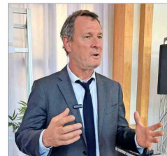
El economista también expuso sobre cómo elevar la productividad en la industria de la construcción.

"Plantear que la manera de salvar el planeta es no crecer es algo que no va a ocurrir: ningún sistema o régimen se ha propuesto nunca dejar de crecer. Sería además totalmente equivocado, porque todavía hay muchas necesidades básicas por cubrir. En todo el mundo, incluso en EE.UU. o Europa. Basta ver los problemas que tienen con la migración. Entonces, es errado sentirse en una empresa (o en cualquier organización) a discutir cuánto estamos dispuestos a sacrificar de crecimiento, rentabilidad o utilidad para hacer del mundo un mejor lugar. La pregunta correcta es cómo mejorar la productividad para tener un planeta mejor y a la vez seguir creciendo, rentabilizando y ganando plata.