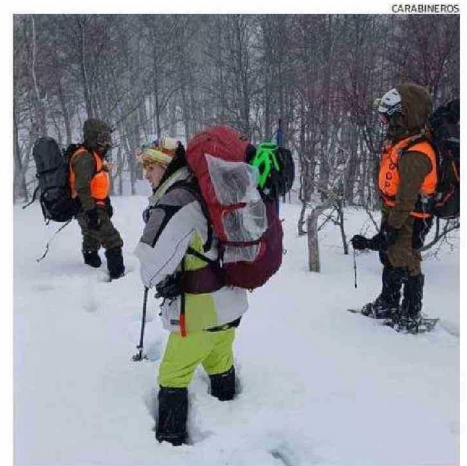
EQUIPOS DEL GOPE LOGRARON UBICAR A LOS EXCURSIONISTAS.