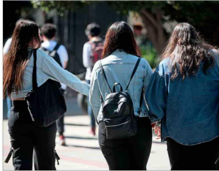
APLICACIÓN. — La encuesta se aplicó a 1.638 personas mayores de 18 años entre el 21 de agosto y el 24 de octubre de este año.

muy alto el que recomienda ir a la universidad porque saben, y otra pregunta de la encuesta así lo corrobora, que quienes salen de la universidad, en términos de su futuro y bienestar econó-