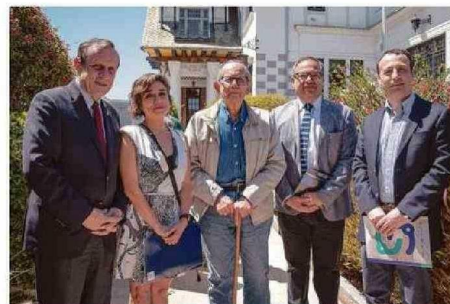
LOS ANFITRIONES, ORGANIZADORES Y ARTISTA (AL CENTRO).

ta, fundador de la Escuela de Grabados de Concepción, profesor emérito de la PUC, Premio Altazor en varias oportunidades y Premio Nacional de Arte 2019. Es una referencia en la historia del arte contemporáneo y formador de muchas generaciones de artistas. Invitamos a que vengan al