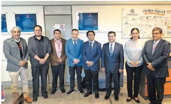
TUVO COMO OBJETIVO PRINCIPAL DESARROLLAR UNA AGENDA DE TRABAJO.

Encuentro entre los sectores público, académico y privado, abordó las oportunidades y desafíos de la nueva industria de energías renovables en la zona.