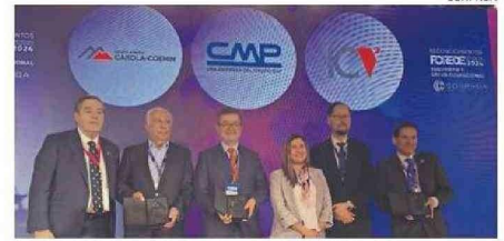
GALARDONADOS EN “SEGURIDAD Y SALUD OCUPACIONAL”.