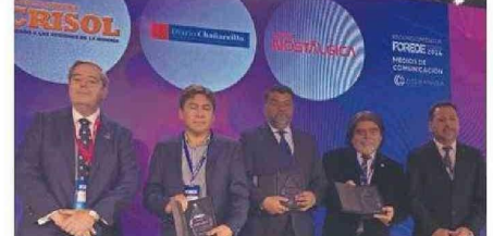
LOS DESTACADOS COMO “MEDIOS DE COMUNICACIÓN”.