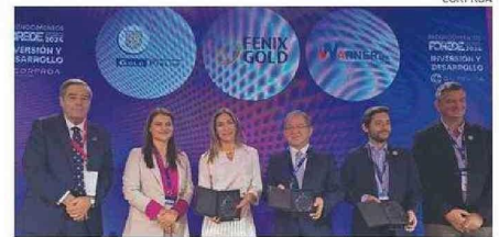
LOS RECONOCIDOS CON EL GALARDÓN EN “INVERSIÓN Y DESARROLLO”.

Finalmente, la ministra Williams valoró la creación de un Clúster Minero en Atacama, explicando que “la creación del Clúster Minero con la adhesión de 13 empresas mineras va a permitir vincularse de mejor manera con el territorio, el empleo local y el desarrollo de proveedores locales que es fundamental para el éxito de la industria minera, que por sí misma sin una cadena de valor que la sustente, sin el talento humano, la verdad que no tiene la fuerza que nosotros hoy día tenemos como país”.