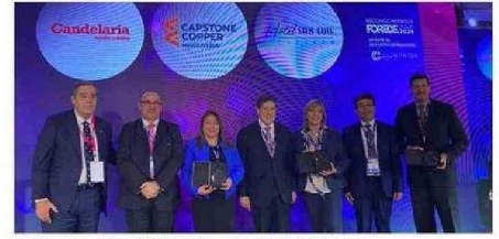
RECONOCIDOS POR “APORTE AL DESARROLLO SOCIAL”.