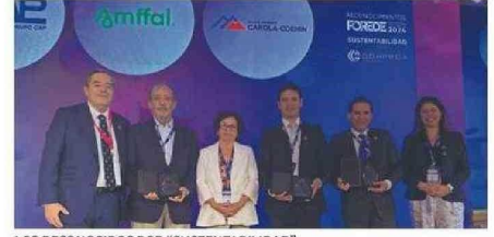
LOS RECONOCIDOS POR “SUSTENTABILIDAD”.