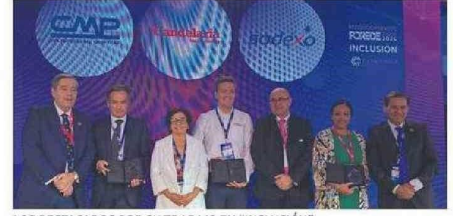
LOS DESTACADOS POR SU TRABAJO EN “INCLUSIÓN”.