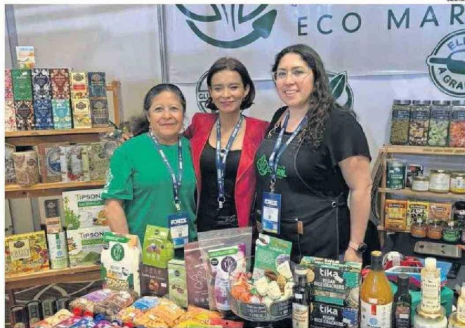
EMPRENDEDORES TAMBIÉN ESTUVIERON PRESENTES CON PRODUCTOS LOCALES.

ria Lunding Mining y Sodexo por su labor en la creación de ambientes laborales inclusivos y diversos. Finalmente, en la categoría de Medios de Comunicación, la Revista Minera Crisol, el Diario Chañarillo y Radio Nostálgica recibieron premios.