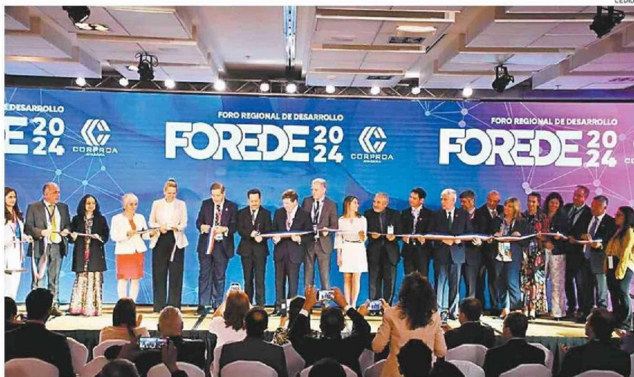
LA CEREMONIA DE INICIO CONTÓ CON LA PRESENCIA DE AUTORIDADES DE NIVEL NACIONAL Y REGIONAL.