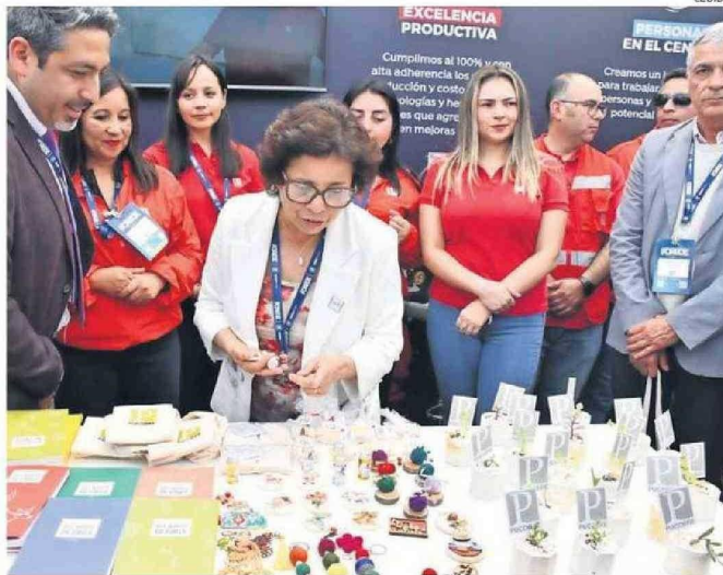
LA MINISTRA WILLIAMS VISITÓ LOS DISTINTOS STANDS DE LAS EMPRESAS.

En términos de Inclusión, se reconoció a CMP, Candelaria