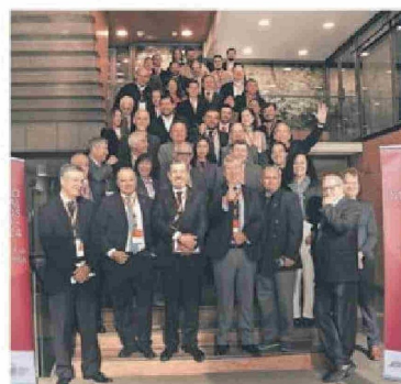
Ⓜ Foto general del Encuentro Internacional de Medios Santiago - Chile 2024.