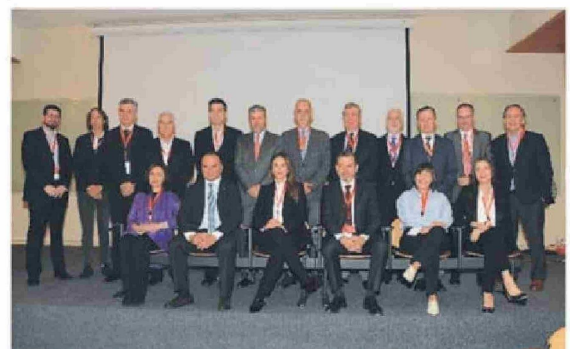
Ⓜ Directiva de Asociaciones nacionales e internacionales firman Declaración Santiago + 30.