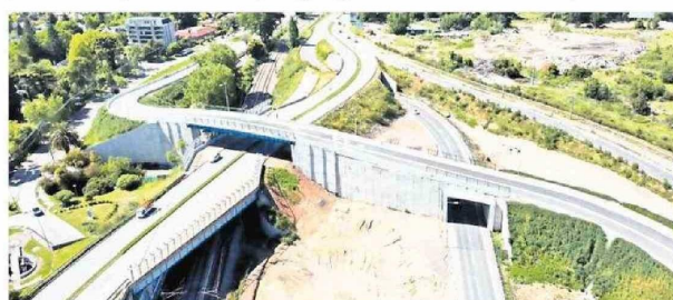
La nueva parte de la doble calzada llegará hasta el empalme 8 Oriente, con conectividad tanto para vehículos, bicicletas y peatones.

En tanto, la propuesta de paisajismo y arquitectura urbana continúa con el perfil ya construido en etapas anteriores, considerando vereda en hormigón y baldosas, arborización, áreas de descanso, miradores, ciclo-vía, y módulos de plantación en base a cubresuelos y herbáceas.