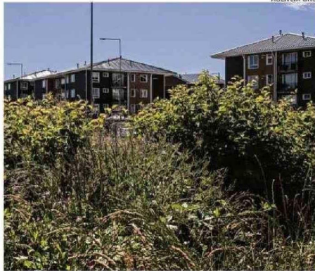
LA GRAN CANTIDAD DE VEGETACIÓN ES LA PRINCIPAL DIFICULTAD.

27 años de existencia tiene la población Juan Pablo Segundo, y nunca se ha cerrado el sitio eriazo.