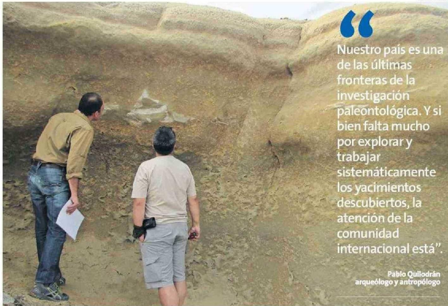
BAHÍA INGLESA ES UNO DE LOS SITIOS FOSILIFEROS MÁS IMPORTANTES DEL PAÍS.

Probablemente, no hay historia más significativa para toda la humanidad y para todos nosotros que la historia de cómo nos transformamos en lo que somos. Y no hablo sólo de la humanidad, hablo