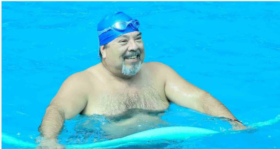
Su rostro feliz lo dice todo. Envejecer con salud es lo primordial.