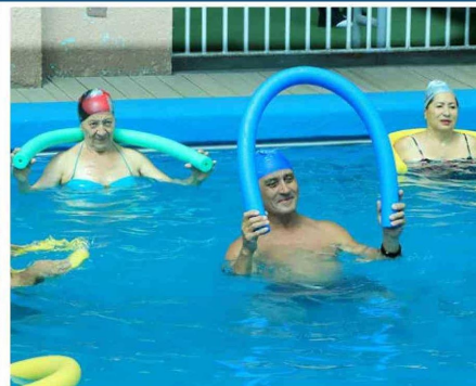
La hidrogimnasia, es parte de uno de los bloques de actividades.