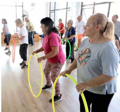
700 personas participan diariamente en las actividades que se desarrollan en el Centro Integral Ariel Standen.

Título: Centro Ariel Standen oportunidad de más vida y salud para adultos mayores