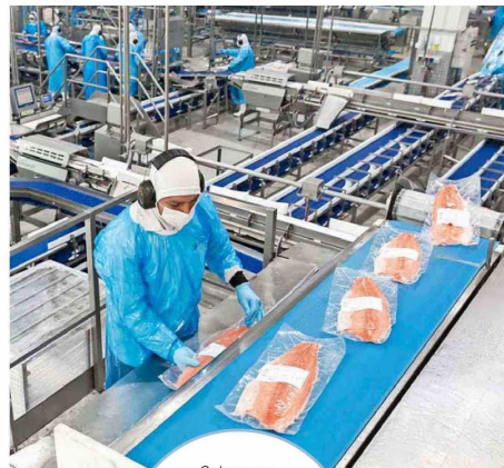
Salmones Camanchaca destaca por su compromiso generando empleo local, alcanzando un 87% de trabajadores provenientes de las zonas donde opera.

Sus avances en índices internacionales junto a otros logros consolidan la sostenibilidad como un pilar estratégico de la Compañía, reafirmando su compromiso con liderar la industria del salmón de manera responsable.