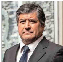
Francisco Estrada, exdirector del Servicio Nacional de Menores.