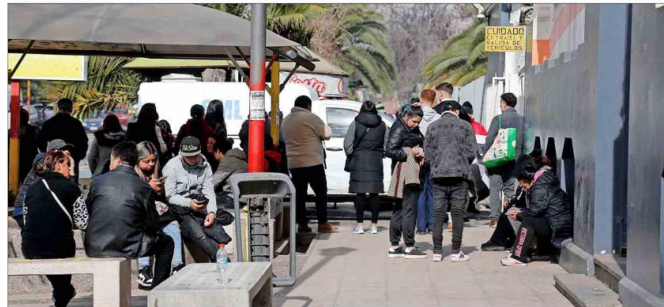
Hasta el Servicio Médico Legal llegaron familiares de los cuatro menores asesinados en una balacera ocurrida el domingo, en Quilicura.

torial que da cuenta de la relación que existe con este tipo de organizaciones. Seis de cada 10 víctimas (menores) participaron en actividades delictivas, es decir, fueron reclutadas por bandas dedicadas a crímenes graves contra las personas. Por el otro lado, cuatro de cada 10 son víctimas totalmente aleatorias del delito, se encontraron en medio de una quitada de droga o en la trayectoria de una bala loca".