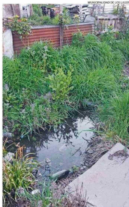
DESECHOS Y ROEDORES MUERTOS: LA REALIDAD DIARIA EN LAS LAJAS.