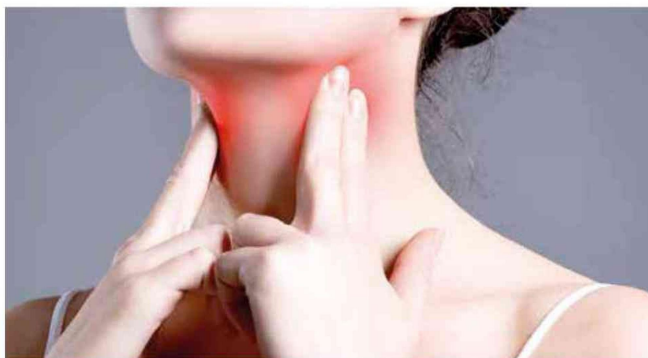
Para evitar complicaciones, lo más importante es palpase el cuello, y verificar si se tiene algún bulto.

El especialista nos habló de la realidad con respecto al mal funcionamiento de este órgano, además de su experiencia en la práctica