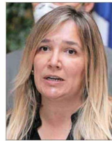
María José Hoffmann (37,49%) postuló por Valparaíso.