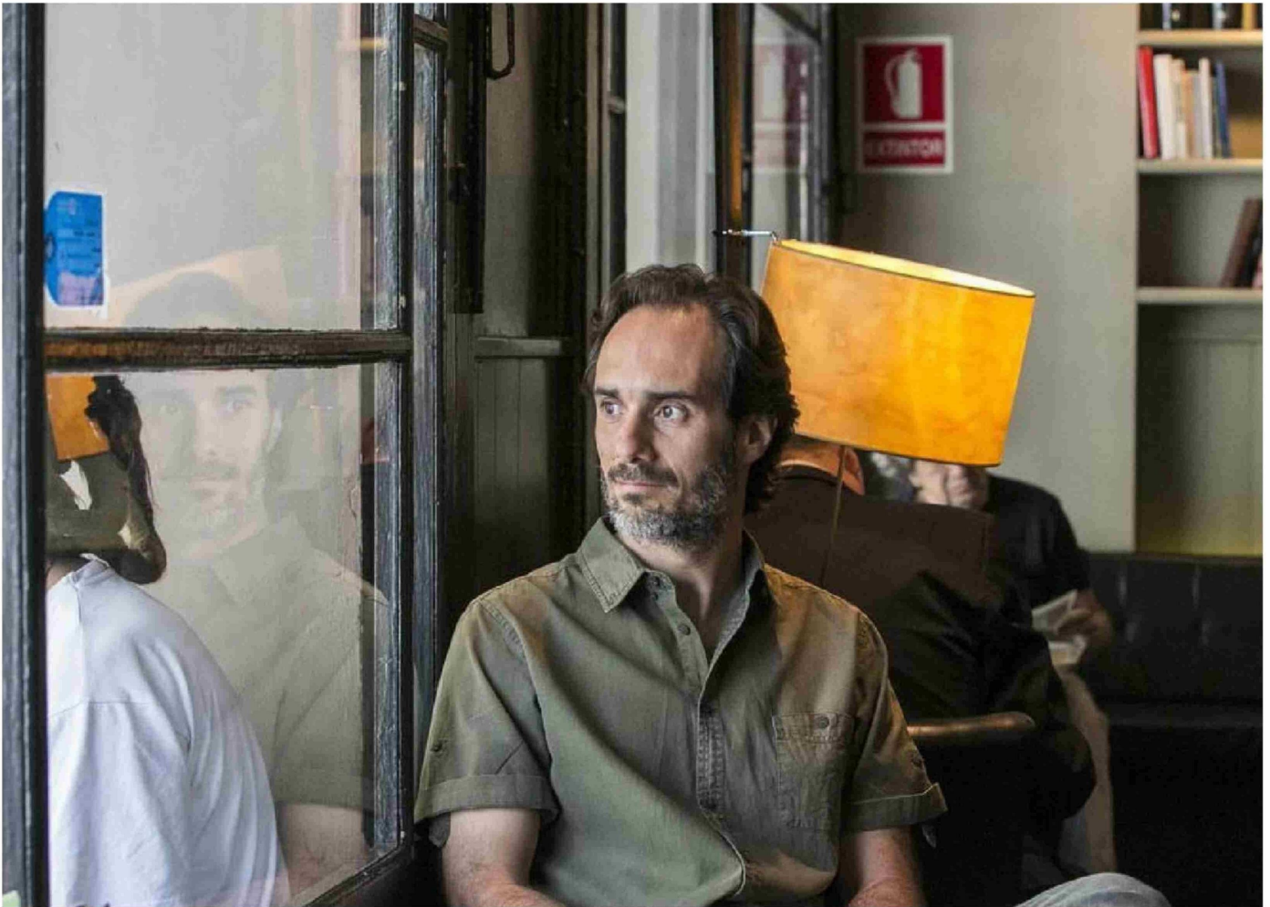
► Los Cuatro Cuentos Cuánticos de Javier Argüello fueron publicados por la editorial Random House.

to involucra otro cuento con el que el protagonista se encuentra en Londres de una manera misteriosa, y que efectivamente está incluido en una antología de la literatura fantástica recopilada por Borges, Bioy Casares y Silvina Ocampo, con lo que se trató de una cuestión más bien fortuita. Lo que no es fortuito es que ellos se hayan interesado por la literatura fantástica, y en ese sentido evidentemente hay una confluencia de intereses con las exploraciones que yo llevo a cabo.