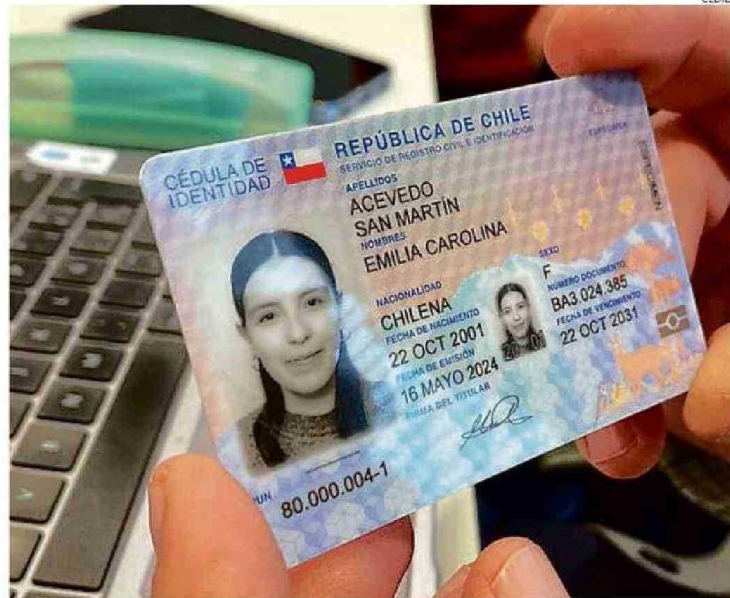
ASÍ SERÁ LA NUEVA CÉDULA DE IDENTIDAD CHILENA.

Ahora, estas nuevas cédulas y pasaportes, que presentan motivos de la flora y fauna chilena, ofrecen una robusta protección contra falsificaciones.