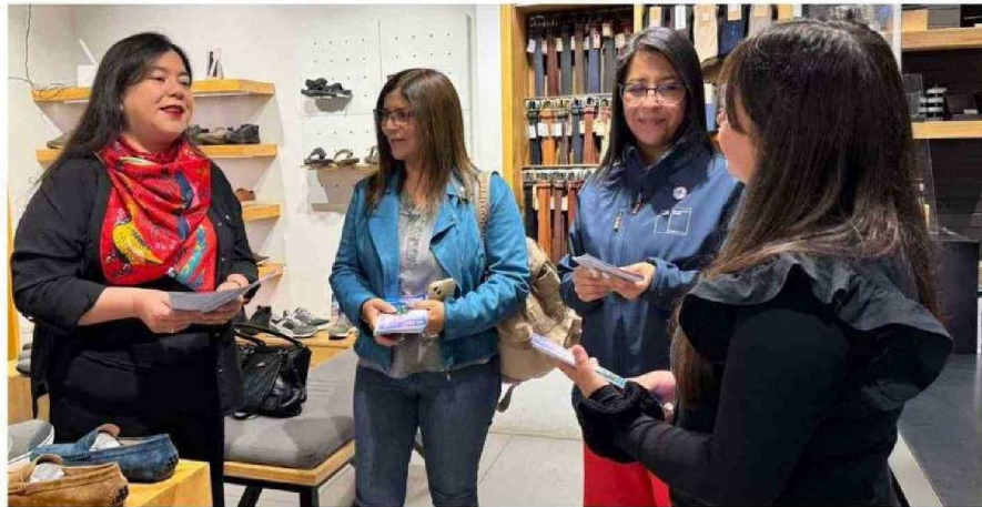
EN LA REGIÓN, QUIENES REQUIERAN MAYOR INFORMACIÓN O QUIERAN HACER DENUNCIAS POR INFRACCIÓN A LA NORMA, PUEDEN COMUNICARSE A LOS CANALES INSTITUCIONALES.

NORMATIVA Por parte de la Dirección del Trabajo, su directora regional,