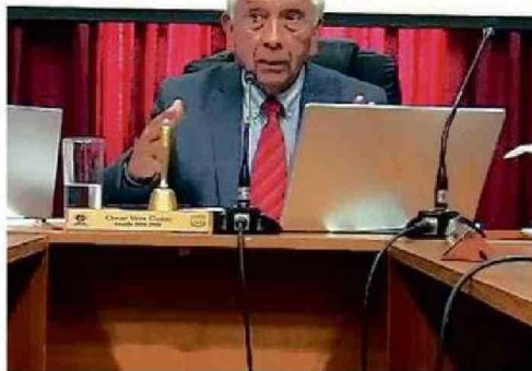
ALCALDE DIO LOS DETALLES CUANDO SE HABLABA DE VEREDAS.

el puente actual o avanzar con el diseño elaborado por el Serviu.