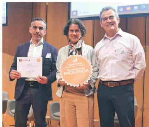
La compañía mide y gestiona su huella de carbono desde 2010, lo que ha sido reconocido por la autoridad ambiental.

La cadena de mejoramiento del hogar y construcción busca aliados para potenciar sus esfuerzos en la protección del medioambiente y mitigación de emisiones. Por ello, integra Pacto Global Chile, el grupo Líderes Empresariales por la Acción Climática (CLG-Chile) y Chile Green Building Council, entre otras organizaciones, junto con participar de iniciativas como "Pacto Chileno de los Plásticos" de Fundación Chile; y "La Hora del Planeta" de WWF Chile.